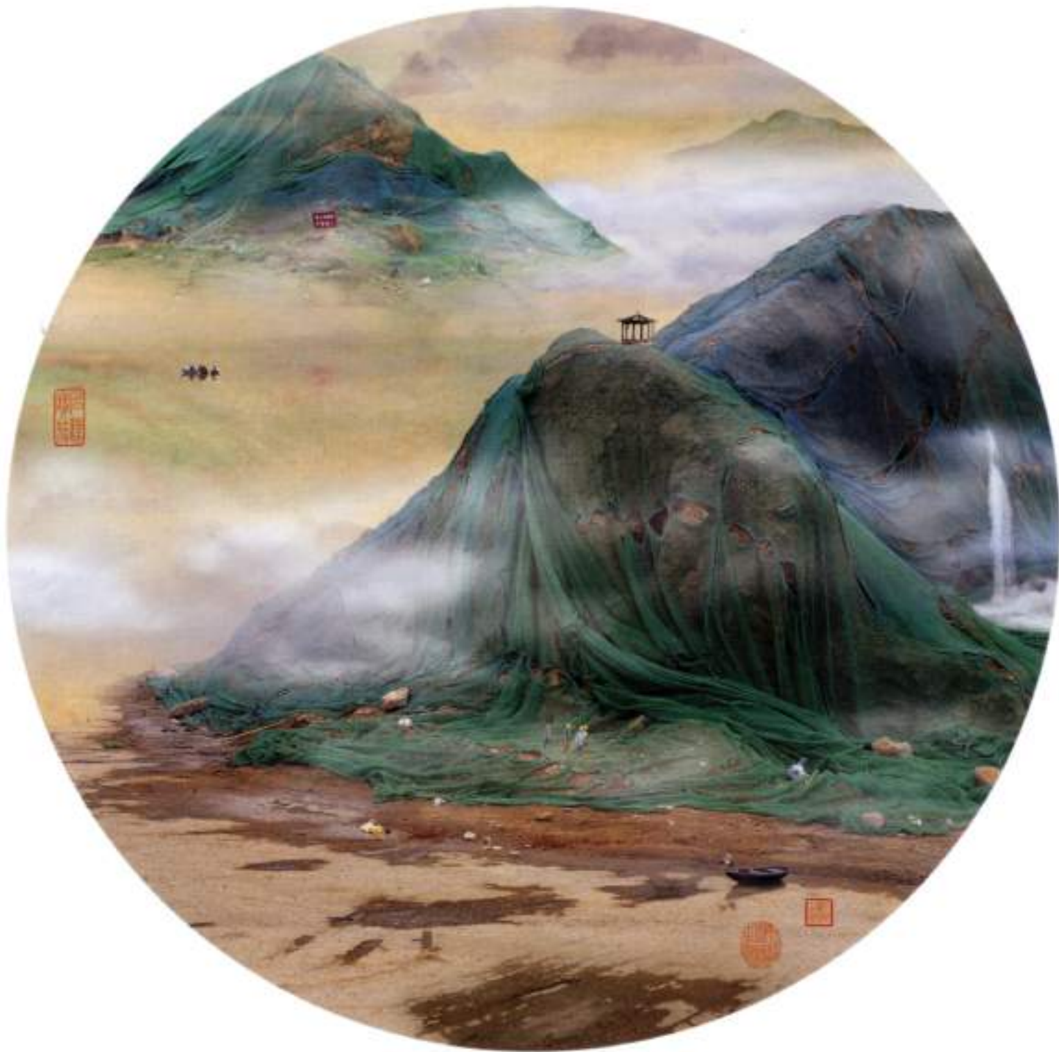
un territoire à bout de souffle la dénonciation de l'intérieur