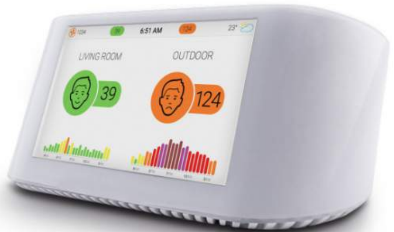
the Node by airvisual@