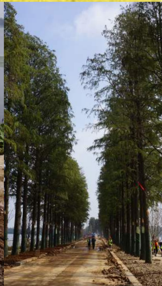
la ville perméable en action ! Wuhan, ville pilote. Automne 2016