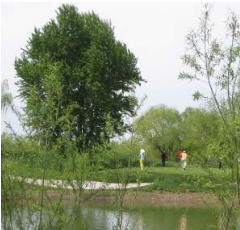
la controverse de l'action environnementale chinoise