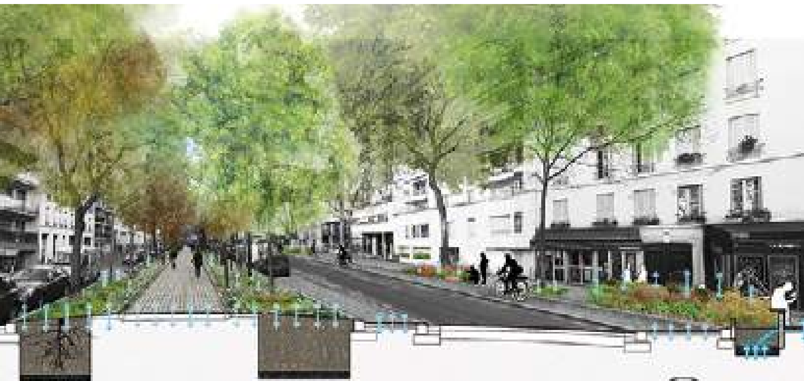
l'exemple du boulevard de Charonne, Paris 11. APUR

ici ou là bas, un possible nouveau paysage urbain rendre l'invisible visible